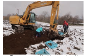
「雪の下 菊芋」の収穫

低温の影響で雪解けが進まず、今年は4月下旬より「雪の下 菊芋」の収穫が行われました。油圧ショベルで固く締まった雪の層を砕きながら畑の表面を出し、畑を乾かします。その後、菊芋の根っこ付近を掘り出し菊芋を収穫します。越冬した菊芋は風味と甘みが増して、晩秋収穫した菊芋同様にシャキシャキとした歯応えがあります。