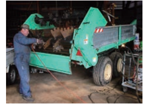
農機具のメンテナンス

この時期の農場担当者は、農機具の点検、整備を行っています。大型トラクターの点検と油圧オイルの交換、自家製たい肥を使った有機農法での土づくりに欠かせないマニアスプレッター(大型たい肥撒き機)など、冬のこの時期にしか出来ない整備をじっくりと時間を掛けて行っています。また、昨年の作柄など栽培記録を基に、今年栽培する品種の選定や作付面積や栽培方法を何度も社員全員で話し合い、春に向けての準備を行っています。